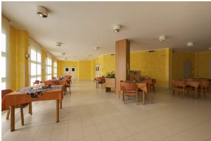
Sala da pranzo al primo piano