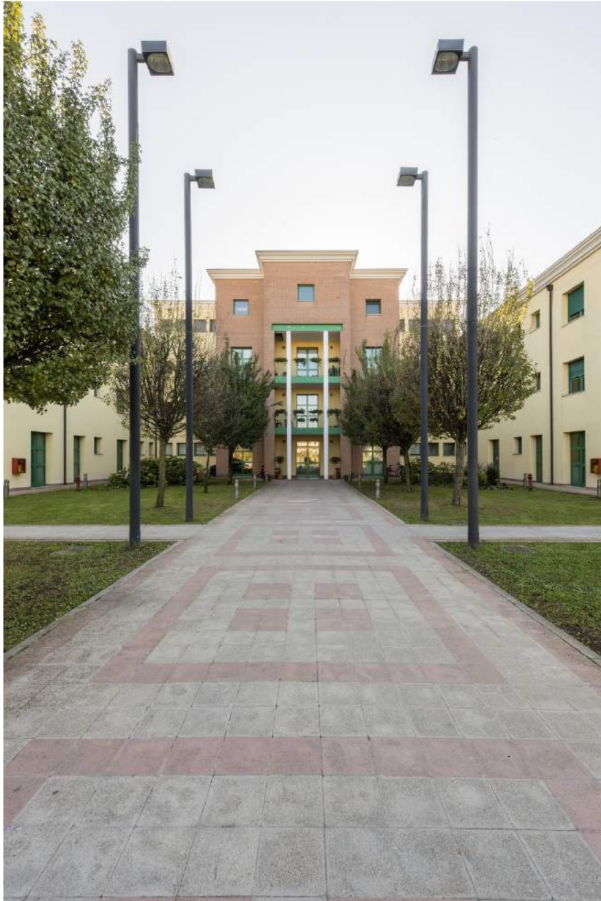
Vista dell'ingresso principale