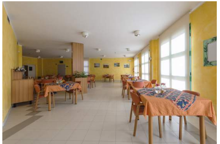
Sala da pranzo piano terra

La sala da pranzo principale, al piano terra , dotata di tavoli e sedie confortevoli, e' rivolta a tutti gli ospiti autonomi nell'alimentazione.