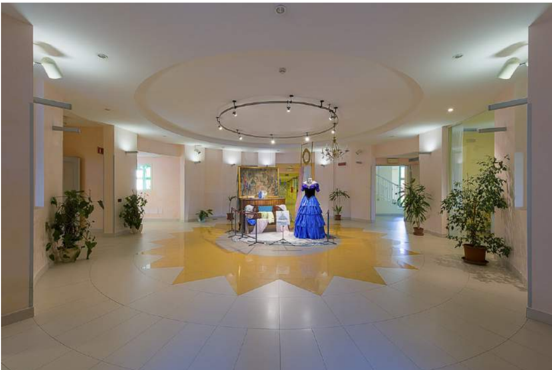
Vista della hall di ingresso